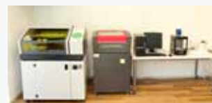
UVプリンター・レーザーカッター・3Dプリンター